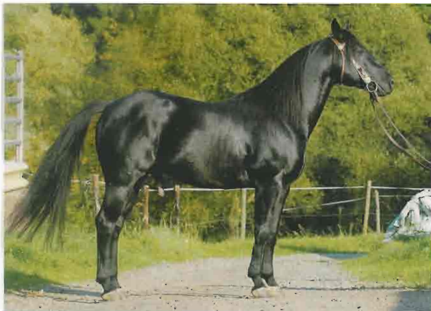
Pferdezucht aus Leidenschaft: Die Jungpferde wachsen auf weitläufigen Koppeln auf (oben).